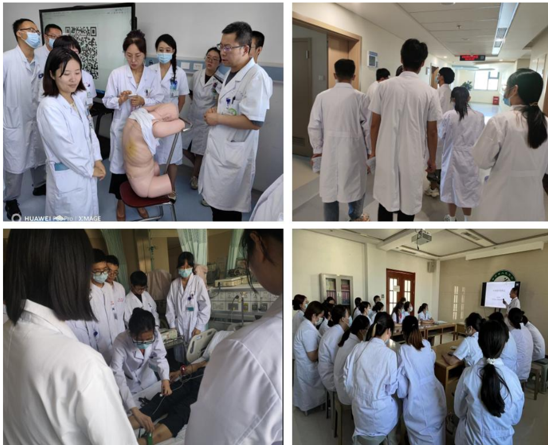
图 1 预防医学专业学生参加临床实习情况

学院非常重视学生实习实践活动，努力构建以实践应用能力培养为目标的合作人才培养模式，提高学生的社会实践能力。学院按照教学计划如期派出 2019 级预防医学专业 57 名学生参加省人民医院临床实习，并于实习前召开实习动员会议，从教学管理、实习纪律等方面教育同学们要珍惜的实习机会，规划好时间，在做好自我保护顺利完成实习的前提下，为自身综合能力和素质提高打下基础。