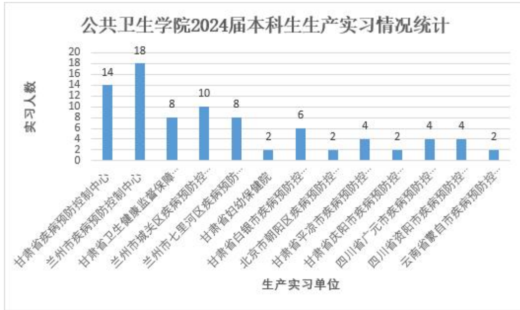
图 2 2024 届本科生生产实习安排情况