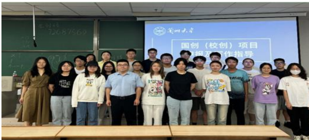
图 2 学术沙龙实况